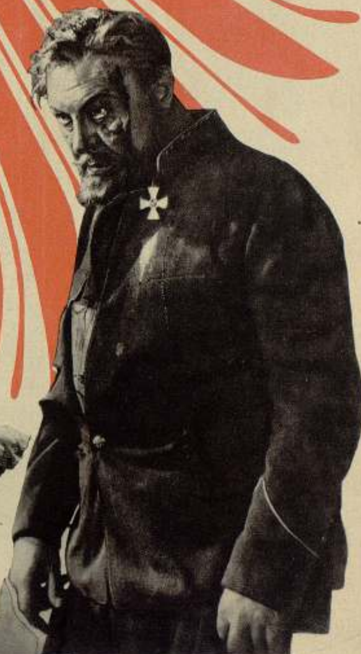
Varias actitudes del coloso de la pantalla, EMIL JANNINGS, en la película Paramount "Última orden", de la que es protagonista en unión de Evelyn Brent y William Powell.