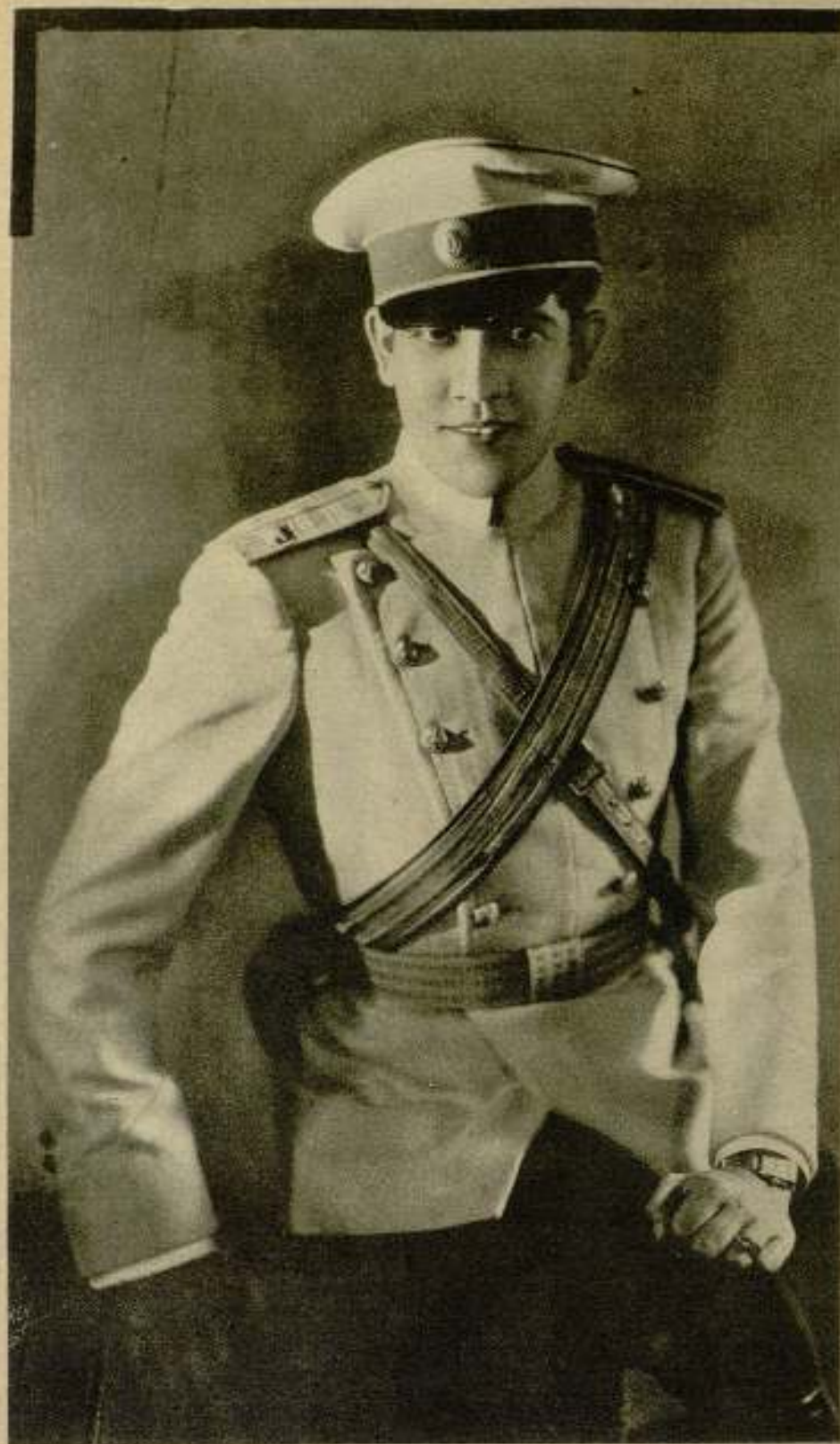
José Mojica en «El príncipe de Arcadia».

El público se ha estremecido durante mucho tiempo con las fechorías de los «traidores» del cine, malvados de todas las especies y categorías, con la consiguiente gama de sentimientos malos que caben en el pecho de un villano.