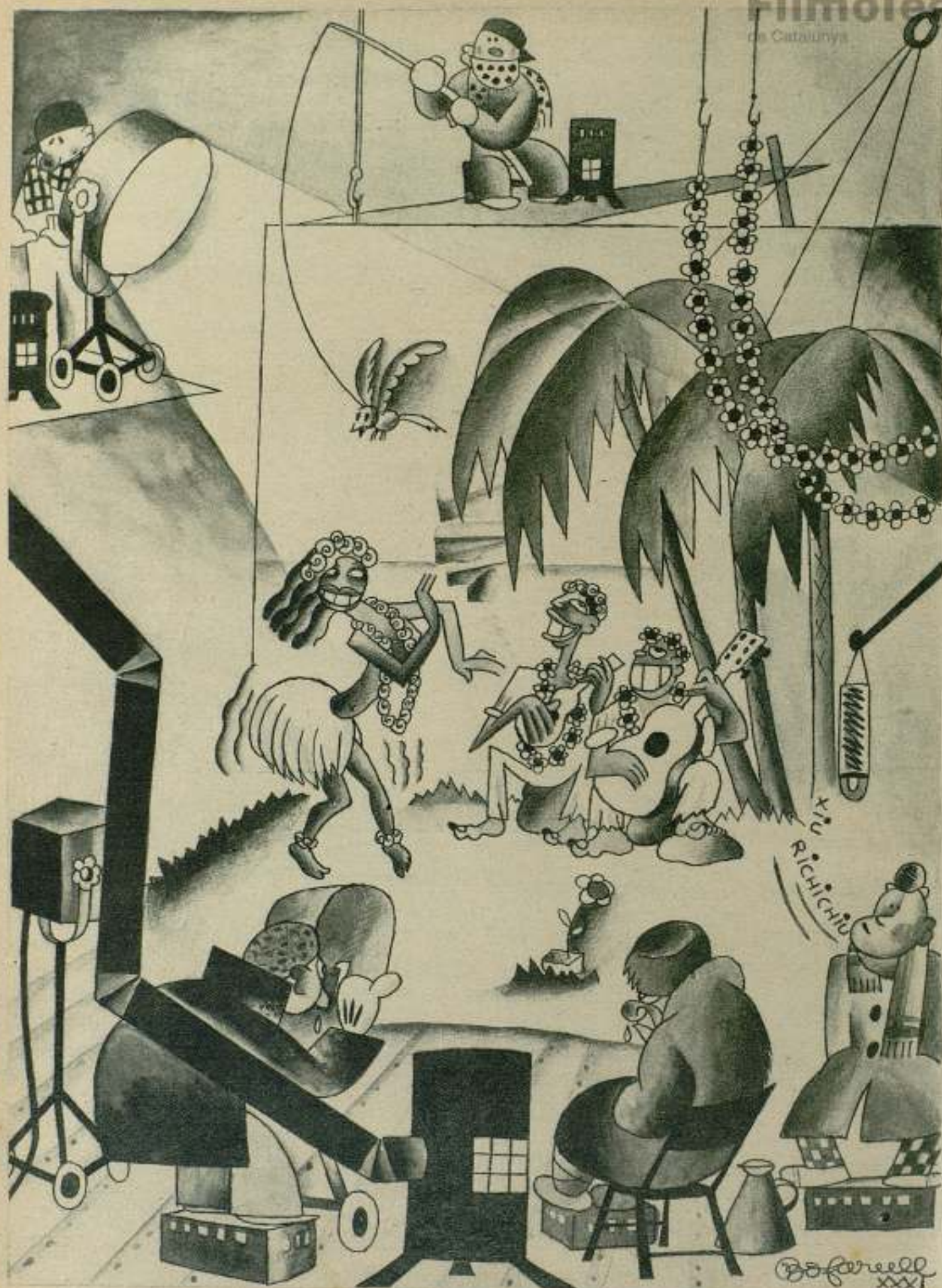
FILMANDO EN PLENO INVIERNO UNA ESCENA TROPICAL