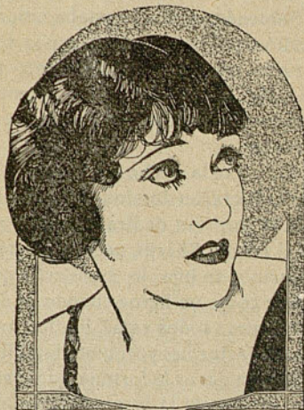
GLORIA SWANSON starring in PARAMOUNT PICTURES

de películas de esta empresa salió hace unos días para Europa en el grandioso trasatlántico "Homerick".