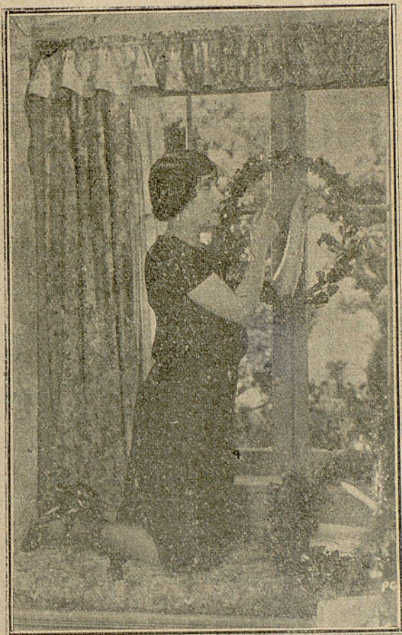
Gloria Swanson, estrella de la Paramount, colgando en la ventana de su casa la clásica corona de hojas de acrobo con la cual en los países del Norte simbolizan las fiestas de Navidad