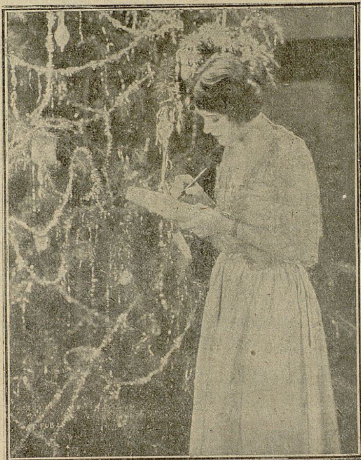
«Felices Pascuas» escribe Constance Binney, estrella de la Realart, en uno de los paquetes que hará feliz a alguno de sus amiguitos durante las Navidades

Acértese Navidad. CINE REVISTA siéntese obligado a dedicarle un artículo, explicando a sus lectores en qué consiste, habitualmente, para los "ases" de la cinematografía, ese día tan severo, esa fiesta de libertad y de olvido. Como sería difícil precisar lo que sucederá este año, to-