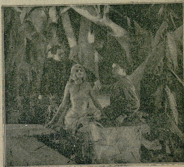
Una escena de la película "La Tierra Prometida."

Gracias a este éxito, los alemanes organizanse para explotar con preferencia ese género de ediciones y, el segundo film "cubista", o sea el segundo film de la serie iniciado con el "Gabinete del Dr. Gahari", está ya concluida. Se llama "La tierra prometida" y CINE-REVISTA publica hoy la fotografía de una de sus escenas. La prensa belga la critica favorablemente. La tercera película de la serie será basada sobre los crímenes de Landrú.