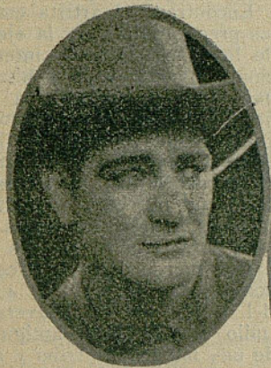
El renombrado artista Art Acord, tal como es