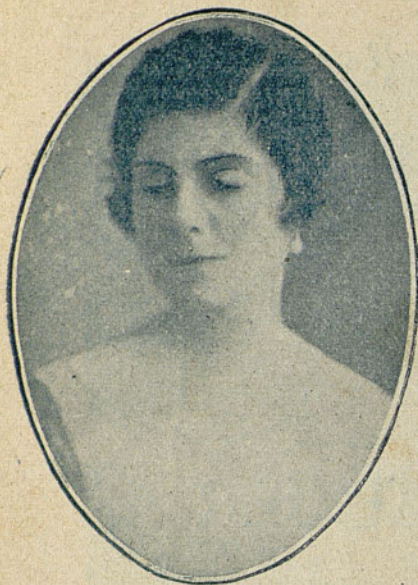
ASPIRANTES A ARTISTAS DE CINE