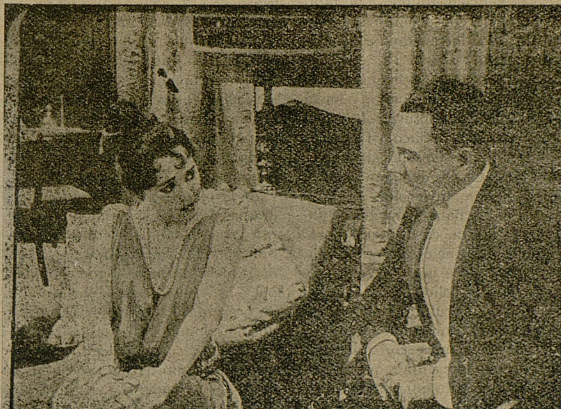
Interesante escena de la sin rival película EL BLANCO TRÁGICO

La Sociedad Kodak en París ha avisado recientemente a su clientela que cierta cantidad de película perforada, negativa y positiva, de su